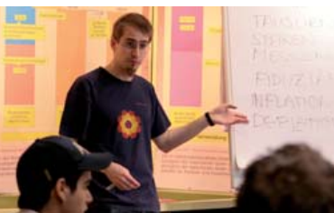
Moderator informiert über Wirtschaft

Der Wirtschaftslehrgang richtet sich durch seine didaktische Gestaltung an alle Altersgruppen, vor allem aber an Schülerinnen und Schüler als Ergänzung zum Unterricht.