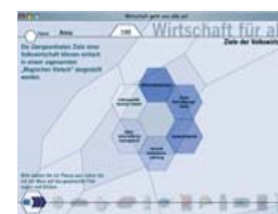
Interaktive, multimediale Computerprogramme

Multimediale und interaktive Lern- und Informationsprogramme stehen auf 40 Apple-Macintosh-Computern mit Internetanschluss zur Verfügung. Diese Programme sind auf die Vortragsveranstaltungen im Wirtschaftslehrgang und in der Lernwerkstatt Österreichs Wirtschaft Elementar abgestimmt. Sie ermöglichen eine individuelle Bearbeitung und Vertiefung der jeweiligen Inhalte.